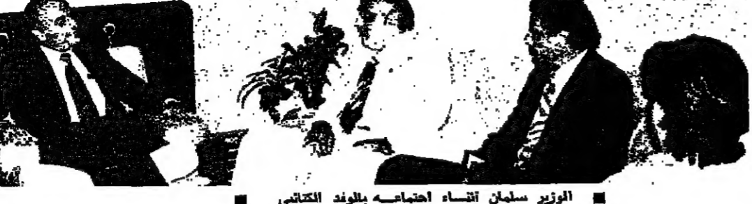
الوزير سلمان اجتمع باعضاء بلوعد الكتابي